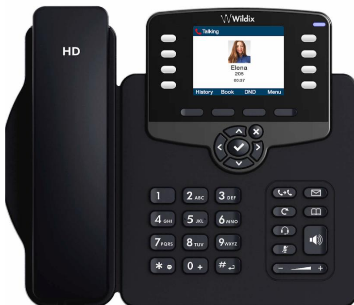
Wildix WP480G telefon

Wildix WP480G/490G telefonile koos veebiportaali toega